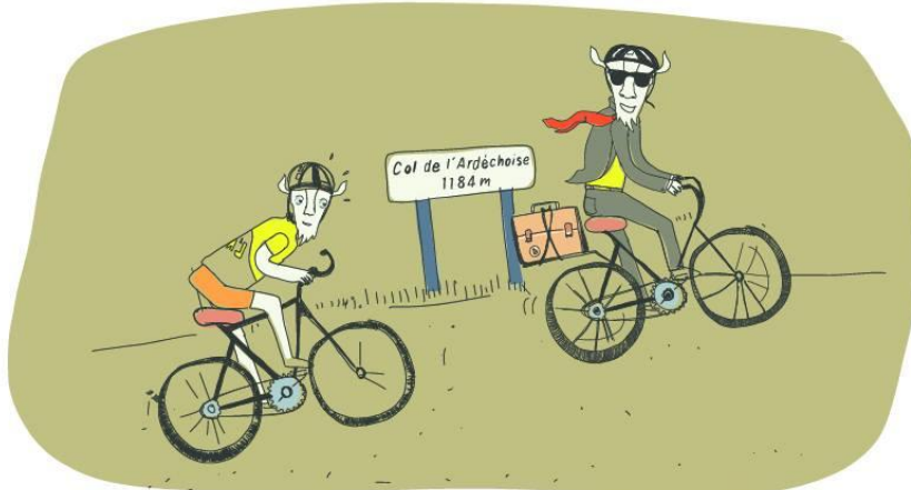
L'échappée du coworking ...