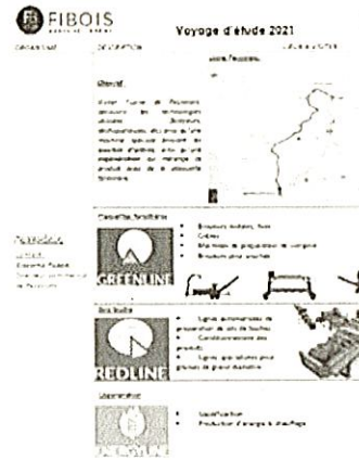
Report du voyage préparatoire au voyage d'études, mais le projet avance très bien grâce à Chloé Muela de Fibois